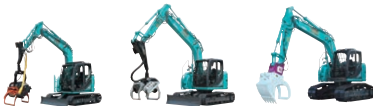
アセラジオスペックSK75SR-3EF アセラジオスペックSK135SR-3F アセラジオスペックSK165SR-3F